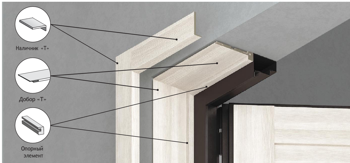
СХЕМА СОЕДИНЕНИЯ ДОБОРОВ С ИСПОЛЬЗОВАНИЕМ ШПОНКИ